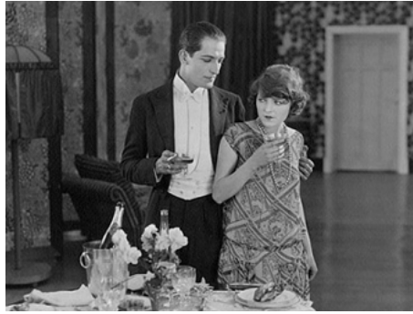
1925 PARIS EN CINQ JOURS de Nicolas Rimsky & Pierre Colombier avec Nicolas Rimsky