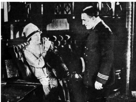
1926 FEU ! de Jacques de Baroncelli avec Charles Vanel