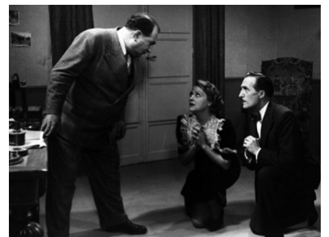
1936 BICHON de Fernand Rivers avec Marcel Vallée, Victor Boucher