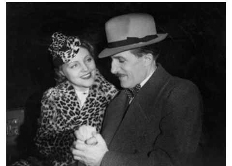
1931 GAGNE TA VIE d'André Berthomieu avec Victor Boucher