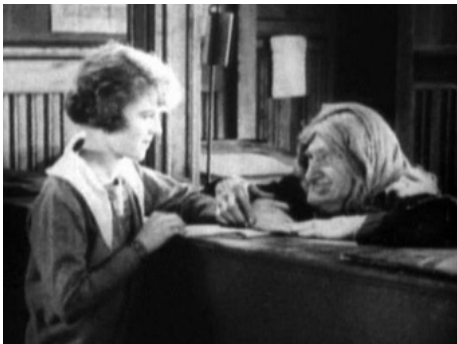
1925 LE VOYAGE IMAGINAIRE de René Clair avec Maurice Schutz