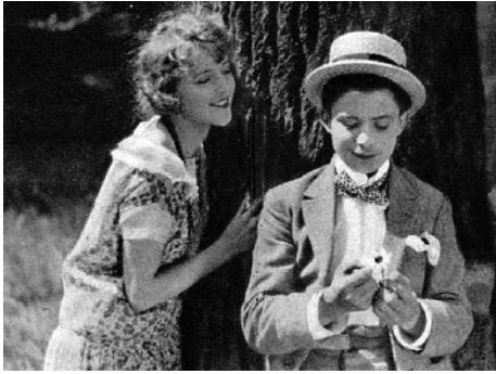
1924 PARIS de René Hervil avec Lucien Legay