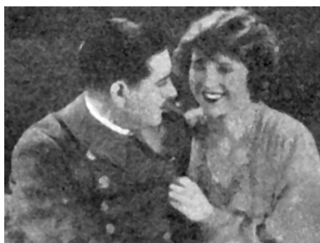
1927 LE CHAUFFEUR DE MADEMOISELLE d'Henri Chomette avec Albert Préjean