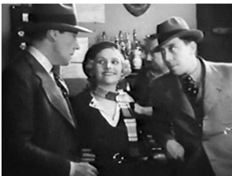
1934 UNE NUIT DE FOLLIES de Maurice Cammage avec Pierre Bertin, Fernandel