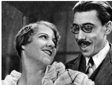
1933 LE GROS LOT ou LA VEINE D'ANATOLE de Maurice Cammage avec Fernandel