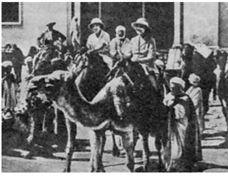
1928 ORIENT (Frauenraub in Marokko) de Gennaro Righelli avec Gregory Chmara