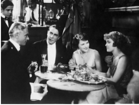
1929 POLICHE (Der Narr seiner Liebe) d'Olga Tschecowa avec Gunnar Tolnaes, Alice Roberts