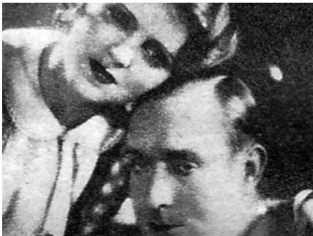
1930 LA CHANSON DES NATIONS de Maurice Gleize avec Jim Gérald