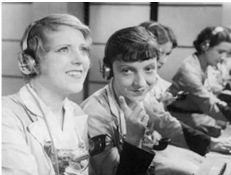
1932 ALLÔ, MADEMOISELLE de Maurice Cammage avec Lily Zevaco