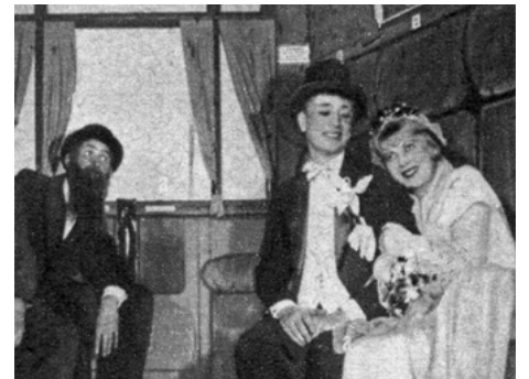
1926 CAFÉ CHANTANT (Das Mädchen vom Tingle-Tangel) de Gustav Ucicky avec Paul Hartmann